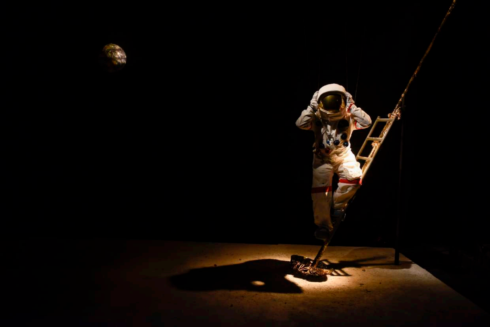
NEIL / 2021 / THEATRE 2.21