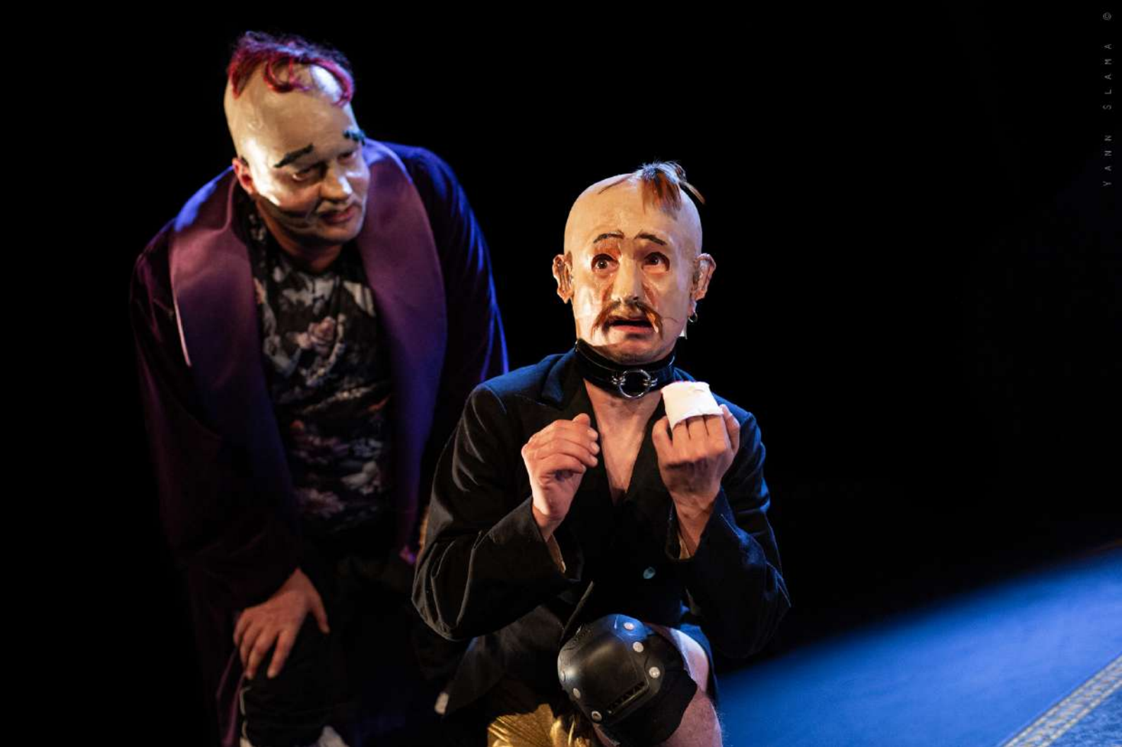
TOUT LE MONDE VEUT VIVRE / 2021 / THEATRE ALCHIMIC