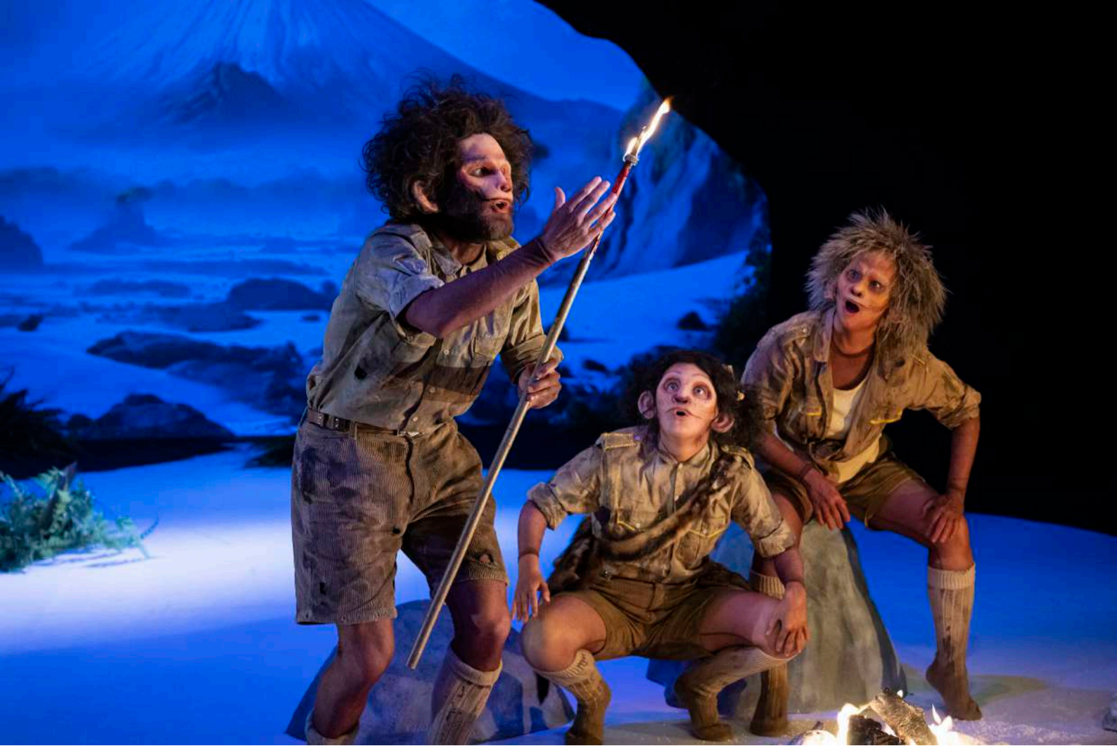
POURQUOI J'AI MANGE MON PERE / 2024 / THEATRE ALCHIMIC / PHOTOGRAPHIES CAROLE PARODI