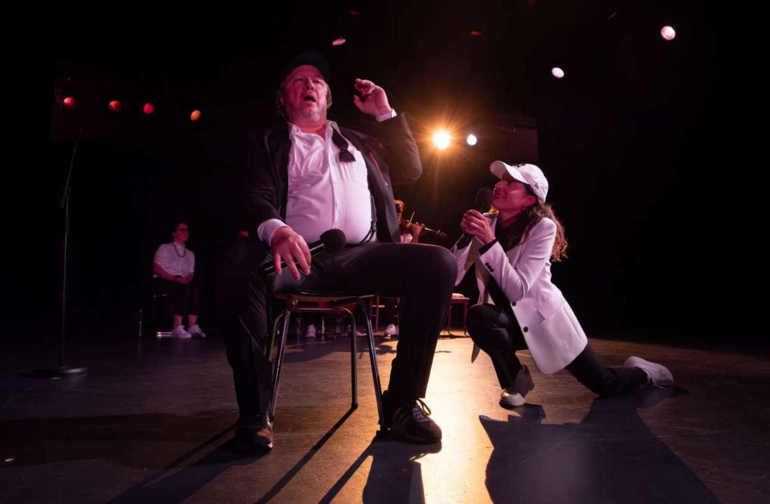
ILLUSIONS / 2024 / CASINO THEATRE DE ROLLE