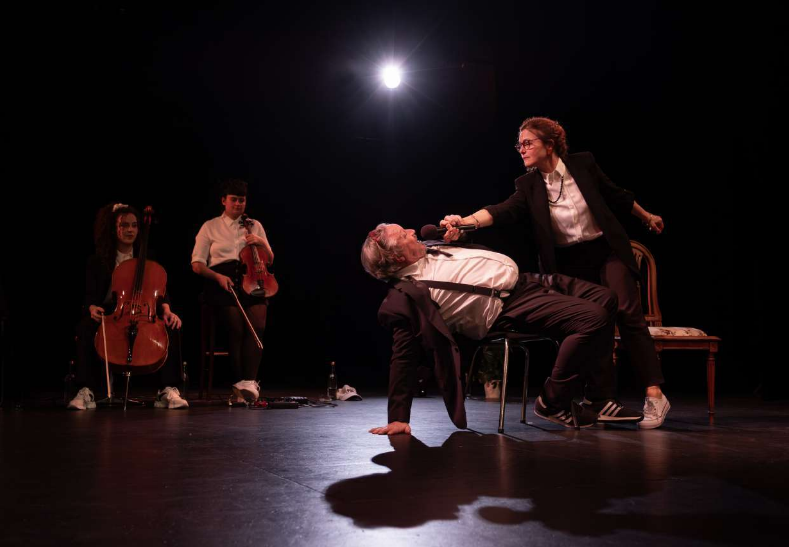
ILLUSIONS / 2024 / CASINO THEATRE DE ROLLE / PHOTOGRAPHIES AURELIA THYS