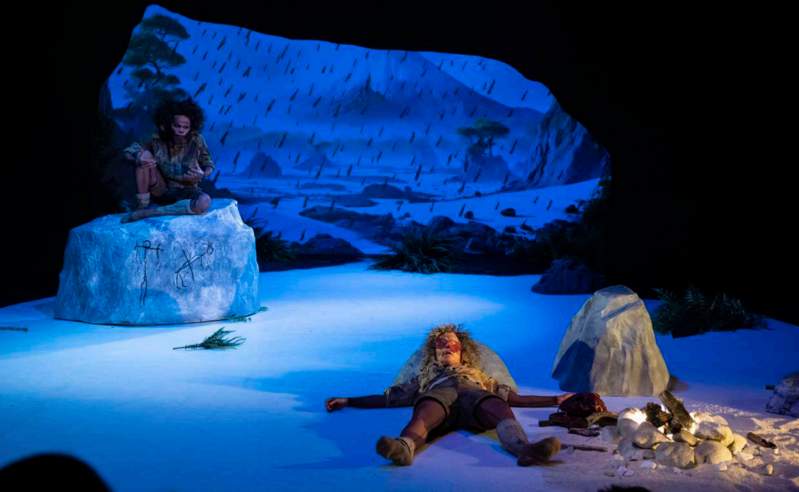
POURQUOI J'AI MANGÉ MON PÈRE / 2024 / THEATRE ALCHIMIC / PHOTOGRAPHIES CAROLE PARODI