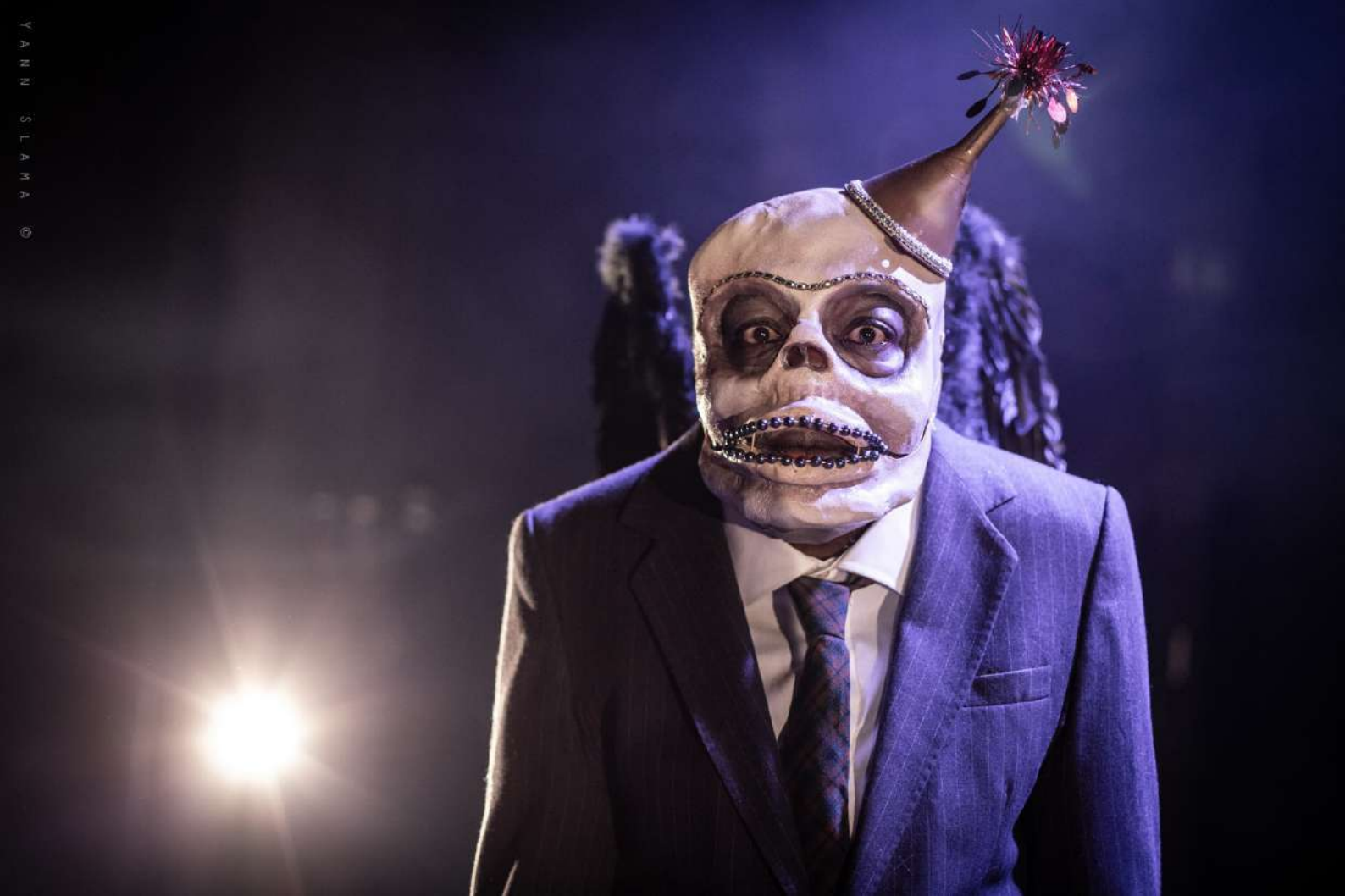
TOUT LE MONDE VEUT VIVRE / 2021 / THEATRE ALCHIMIC