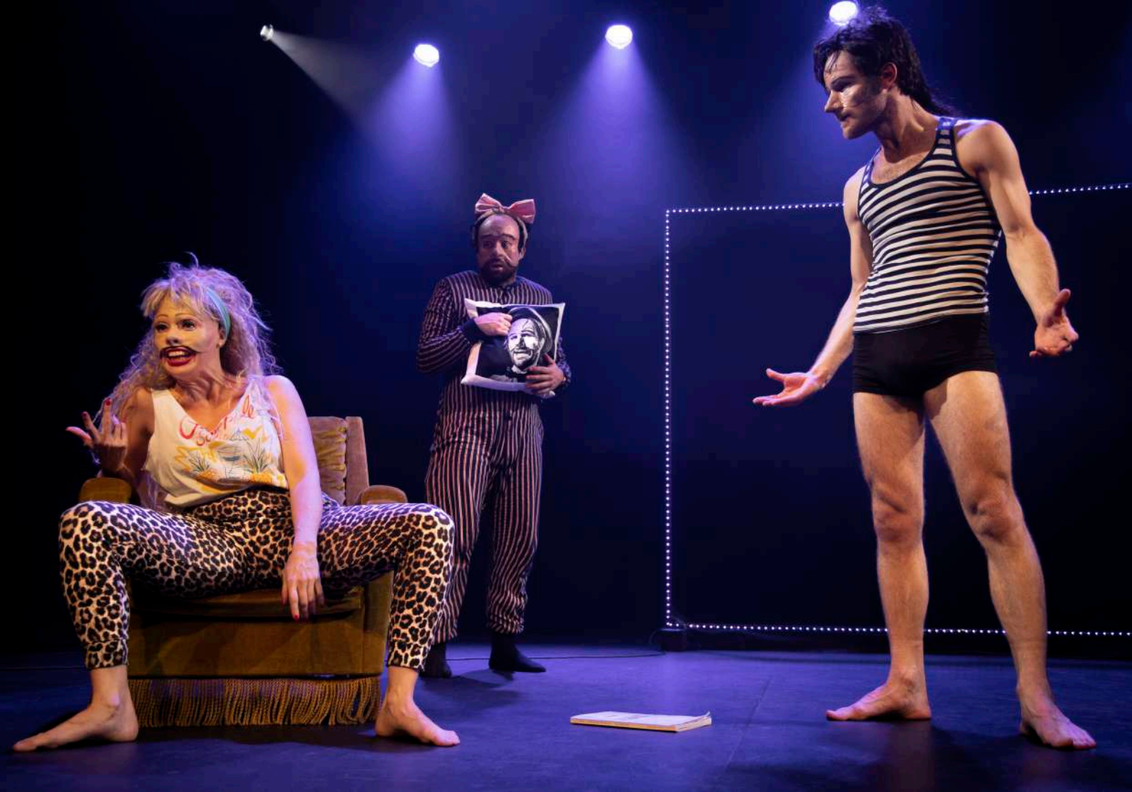
YAACOBI ET LEIDENTAL / 2023 / THEATRE ALCHIMIC